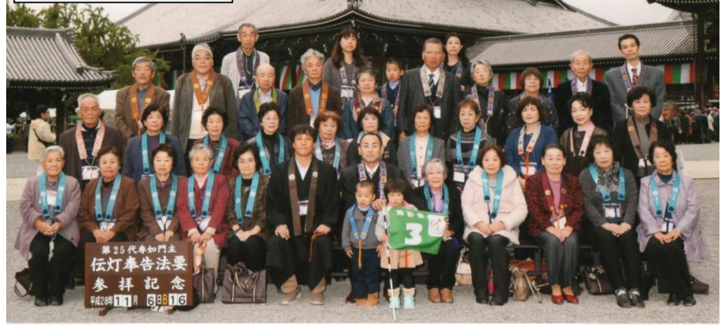
光遍寺と大塔の称名寺と合同で記念写真撮影を行いました。

平成 28 年 11 月 6 日(日)に浄土真宗本願寺派第 25 代専如門主伝灯奉告法要 吉野南組団体参拝を行いました。総勢 130 名の団体参拝となりましたが、無事事故もなく参拝を終えることができました。法要後には、新門主様ご家族のインタビューも行われ親しみやすいお人柄も拝見することができました。