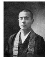
鏡如上人(大谷光瑞)